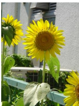
園庭に咲く向日葵